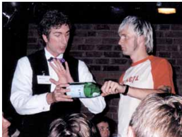
Magische Momente mit Olympiasieger Nils Schumann